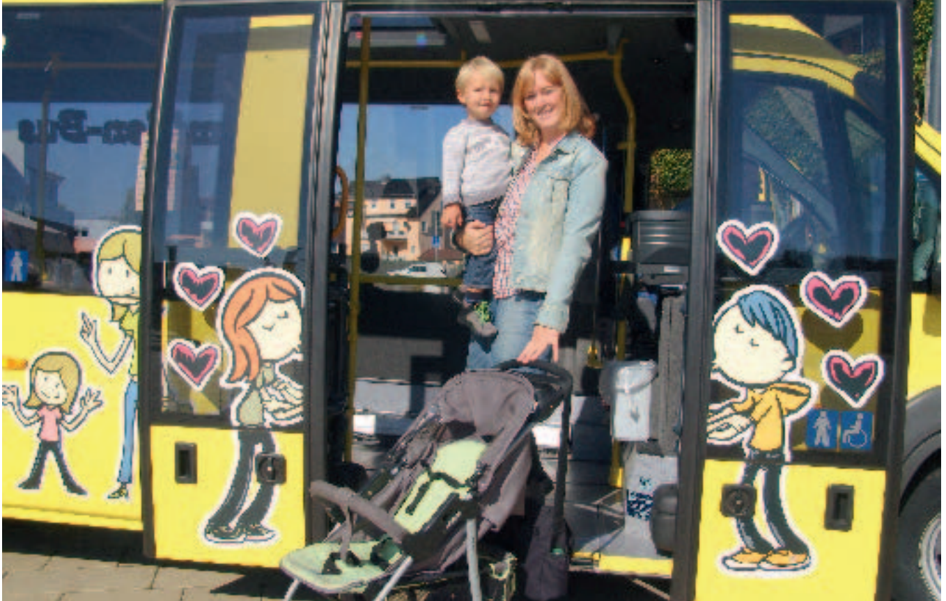
Siegerfoto vom Familienbus-Fotowettbewerb 2012.