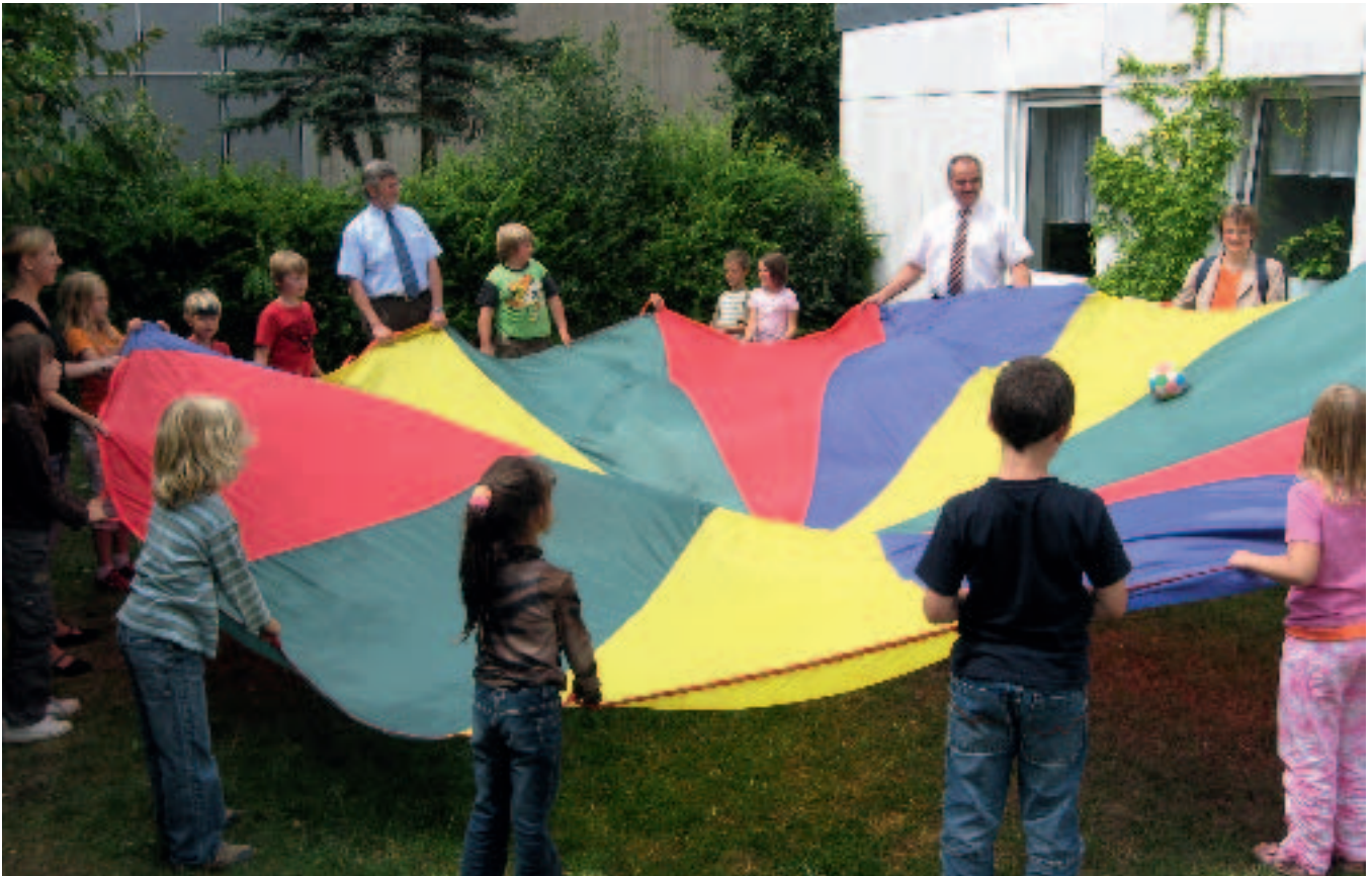
Spielende Kinder während einer Nachmittagsbetreuung im Landkreis Ansbach.

aufgezeigt werden. Dabei ist es für die Projektgruppe von großem Vorteil, dass sie mit einer Vertreterin der IHK Nürnberg für Westmittelfranken und einem Vertreter der Wirtschaftsjuvenen Ansbach „Türöffner“ in den unternehmerischen Bereich an ihrer Spitze hat.