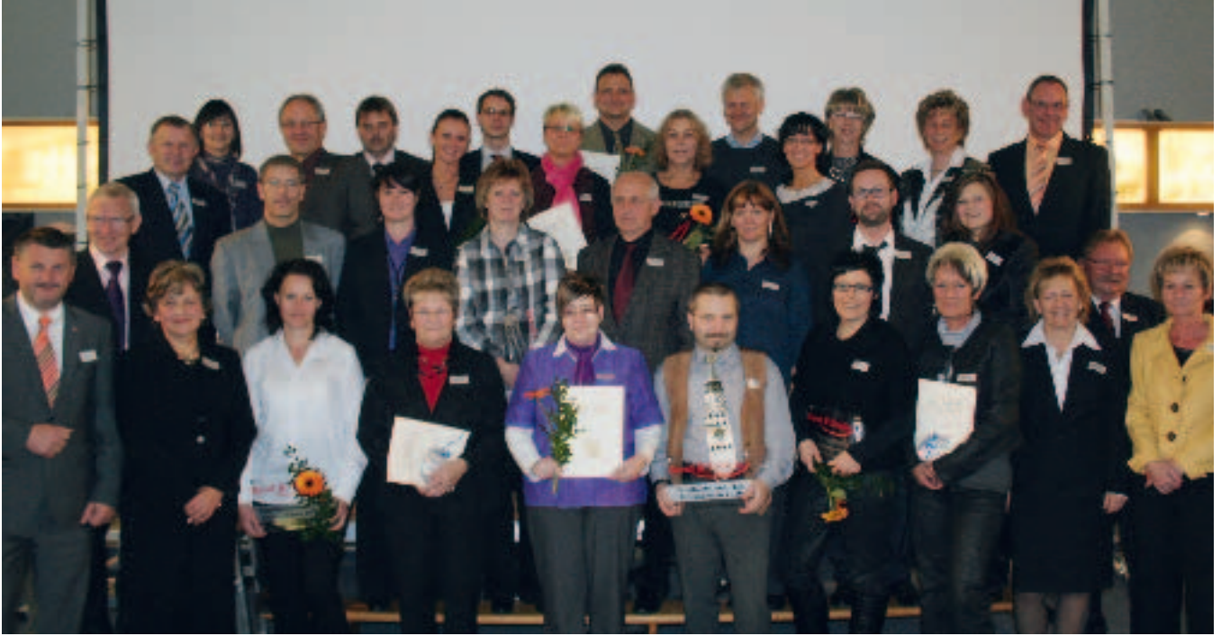
Die Preisträgerinnen und Preisträger des Wettbewerbs „Familienfreundliches Unternehmen im Landkreis Anhalt-Bitterfeld 2010“.